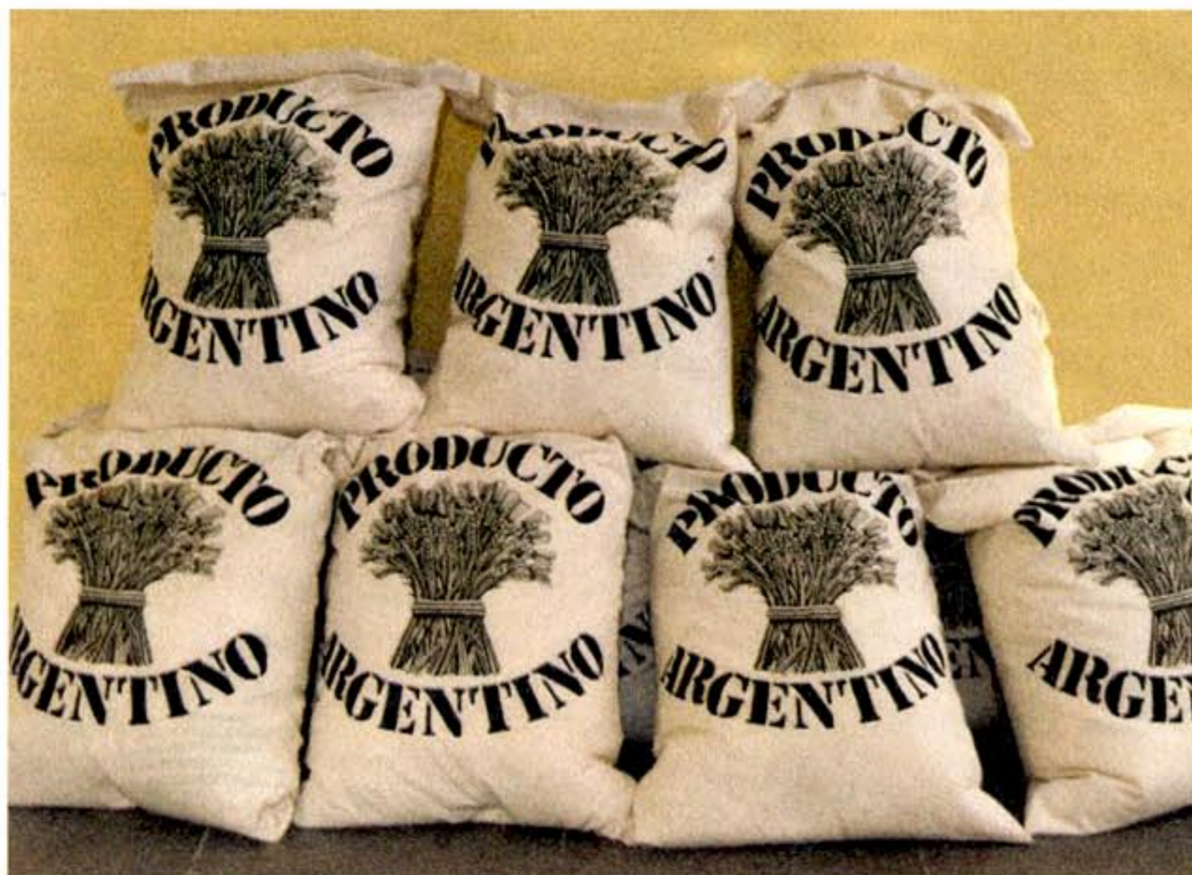
"Granero del mundo", de Vicente Marotta.

En la Casa del Bicentenario se inauguró una muestra que recorre la compleja relación entre economía y política a lo largo de los 200 años de historia de la Argentina. Un muy didáctico recorrido.